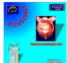
Der RisikoCheck Eine neue Chance für präventive Medizin